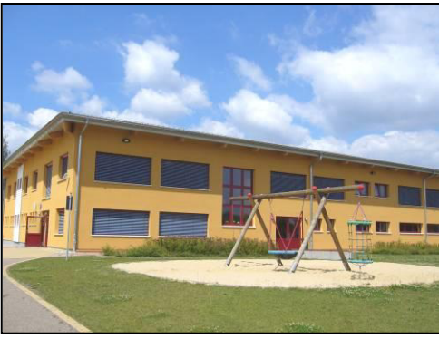
Serbskŕa zakłŕadna ŕula Rabicy